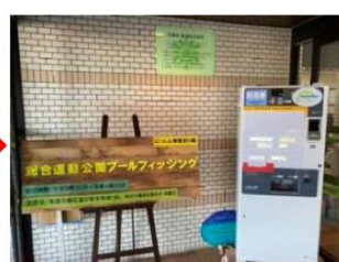
入場券を購入する！ ↓