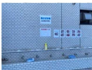
釣った魚はここで捌きます