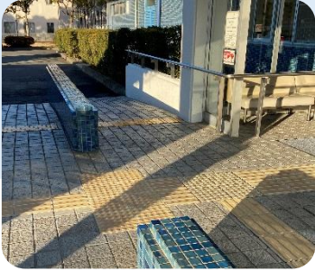
入り口部分のスロープ