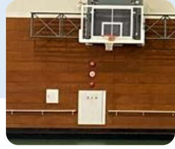
ロビーだけでなく、体育室の中にも手すりがあります