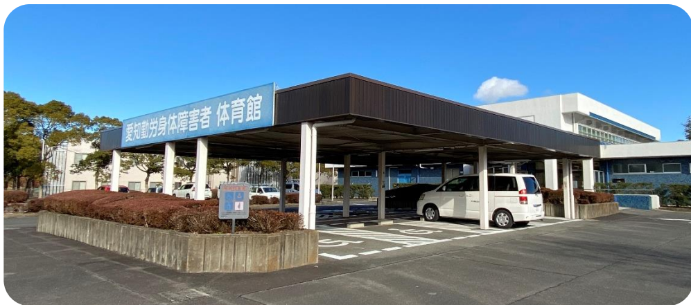
愛知勤労身体障害者体育館 外観

勤労身体障がい者の方が利用する場合は無料、その他の方は、利用料金が必要になります。