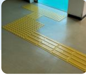
トイレまでの点字ブロック