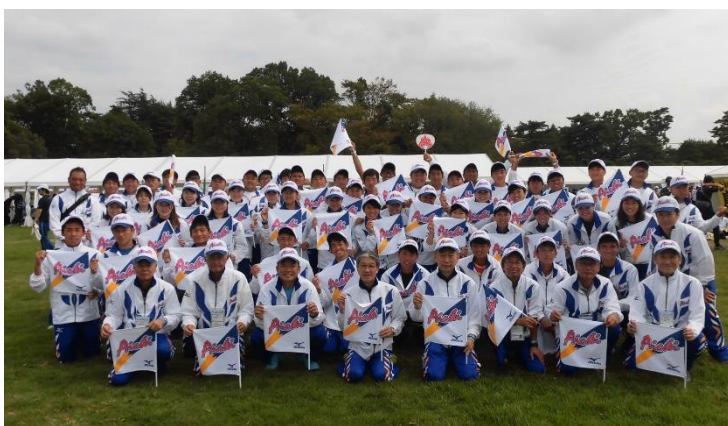
【第74回いきいき茨城ゆめ国体開会式】

そして、1946年に第1回大会が開催されて以来、「国体」として親しまれてきた国民体育大会は、2024年に佐賀で開催される大会から、名称が「国民スポーツ大会」に変更となります。