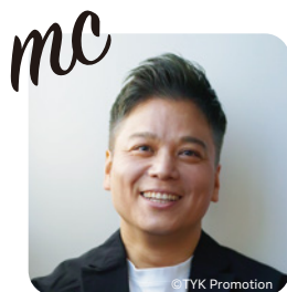
YO!YO!YOSUKE 氏 スポーツDJ・タレント